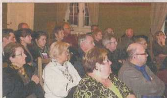
■ Écoute et échanges.